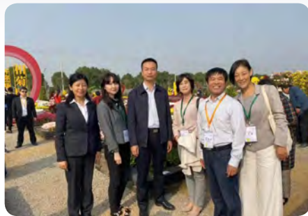
JSPS 中国同学会年会 (南京农业大学湖熟菊花基地、2019.11.03)