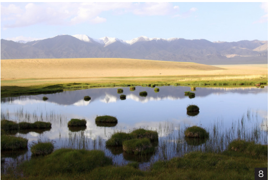
1、2 河南淇河国家湿地公园 4、8 甘肃阿尔金