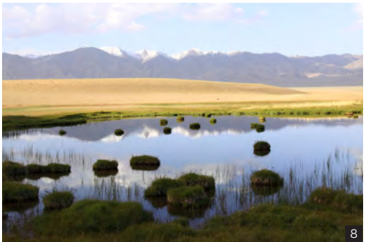
1、2 河南淇河国家湿地公园 4、8 甘肃阿尔金