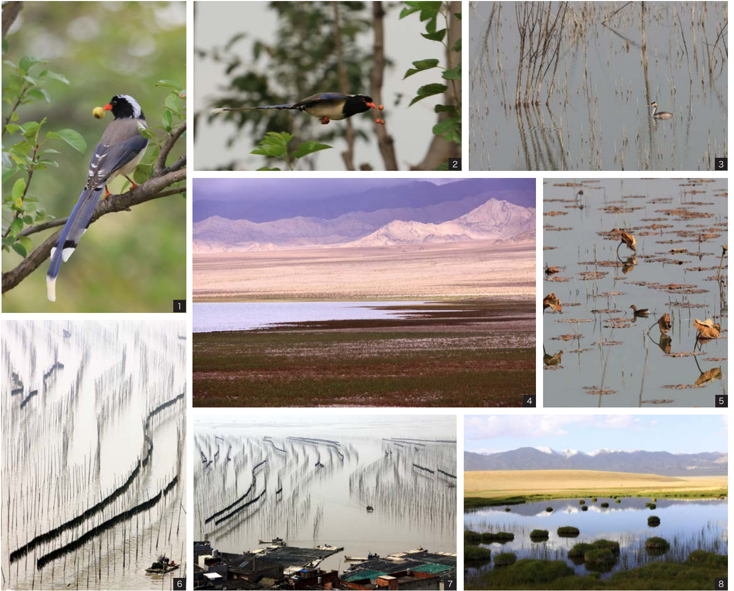
1、2 河南省淇河国家湿地公园 4、8 甘肃省阿爾金