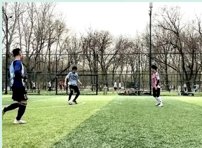
周末练习五人制足球的朝阳公园