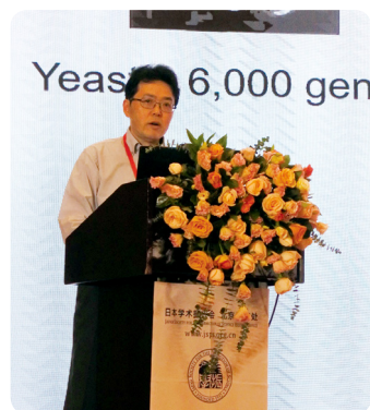
东北医科药科大学顾建国教授