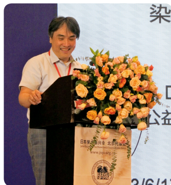
公益财团法人癌症研究会旦慎吾部长