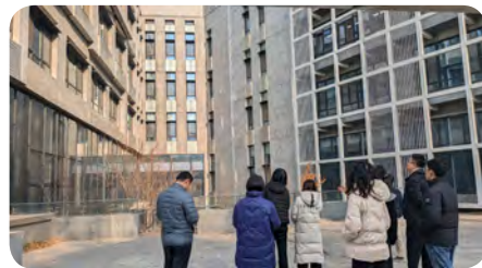
参观 7 号馆

持包括研讨会在内的 JSPS 中国同学会的各类活动，争取吸引更多的中国学者与日本开展学术及科研交流。